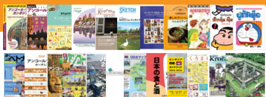
撮影、編集、営業等業務実績一覧

カンボジアでの各種出版物、映像撮影、編集制作、メディアサポート、営業代行 全般承っております。